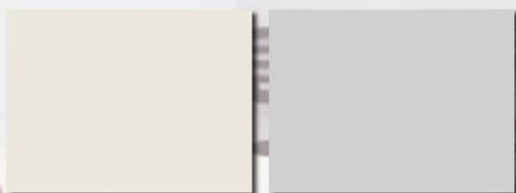
TABELLA COLORI DEI PANNELLI IN LAMINATO