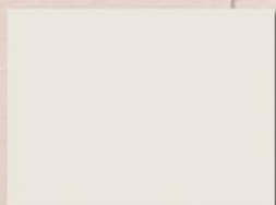
TABELLA COLORI DEI PANNELLI IN LAMINATO